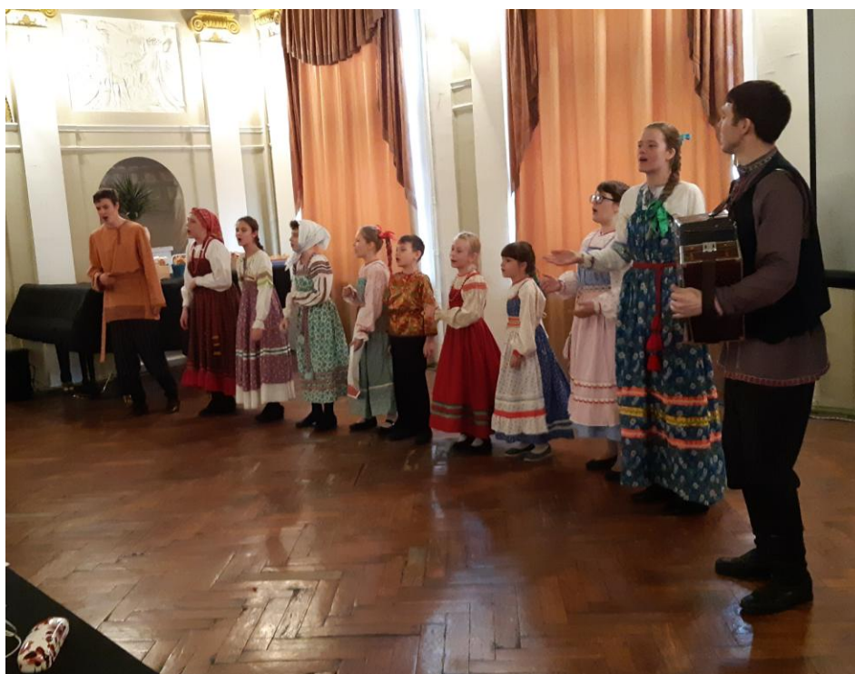
Фольклорный ансамбль «Веснушки»

МБУ ДО «Детская школа искусств № 2 “Гармония”» г. о. Чапаевск Руководитель – Е.С. Гончаренко, концертмейстер – М.А. Родионов