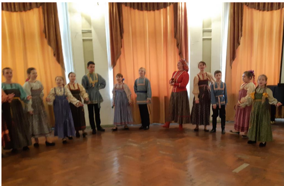
Фольклорный ансамбль «Забава»