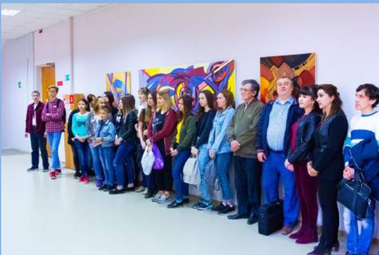
Участники и гости выставки «Музыка джаза»