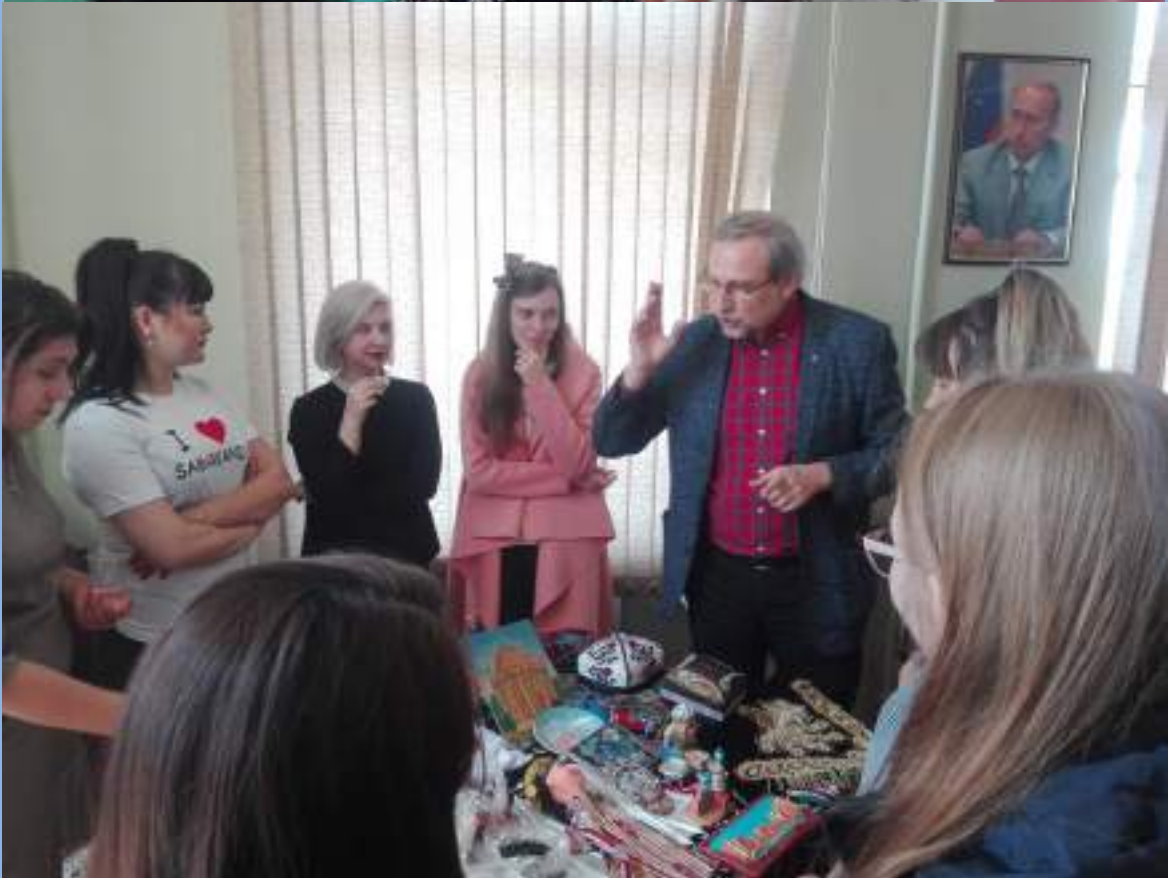
На выставке традиционных атрибутов узбекской культуры