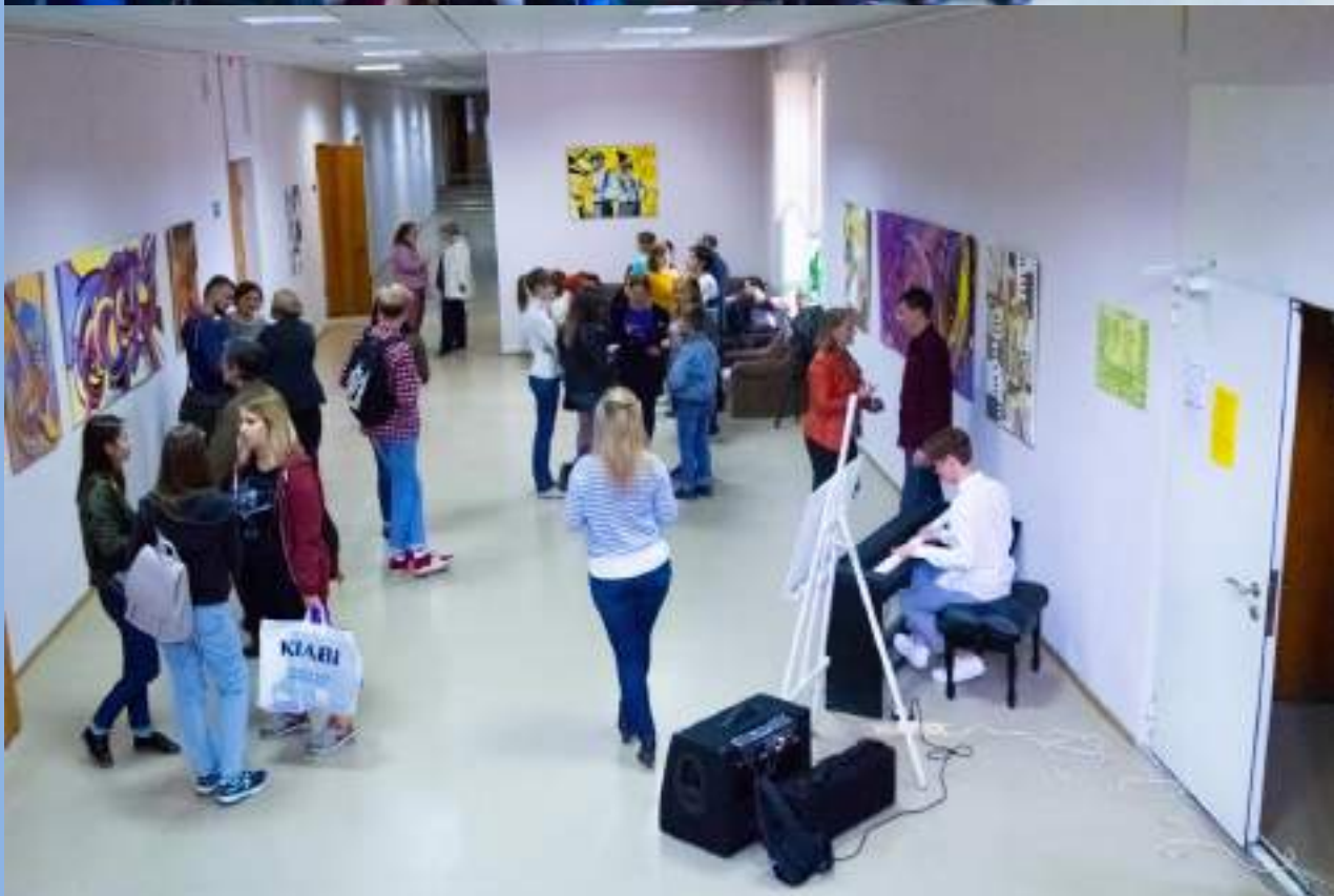
В кулуарах выставки «Музыка Джаза»