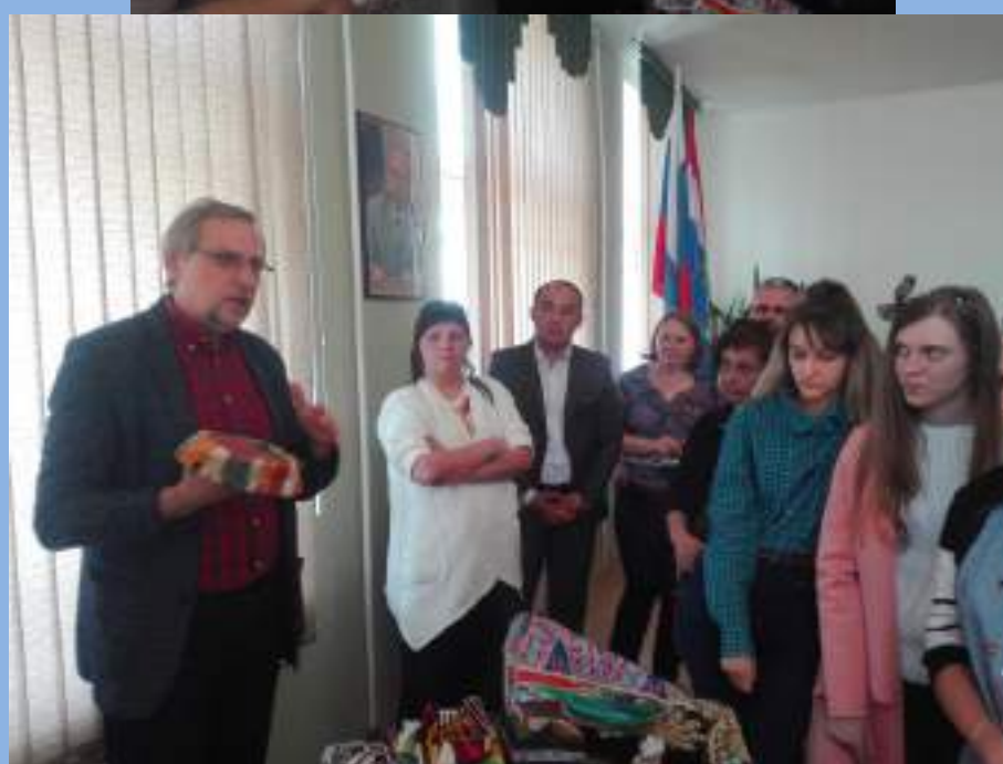
На выставке традиционных атрибутов узбекской культуры