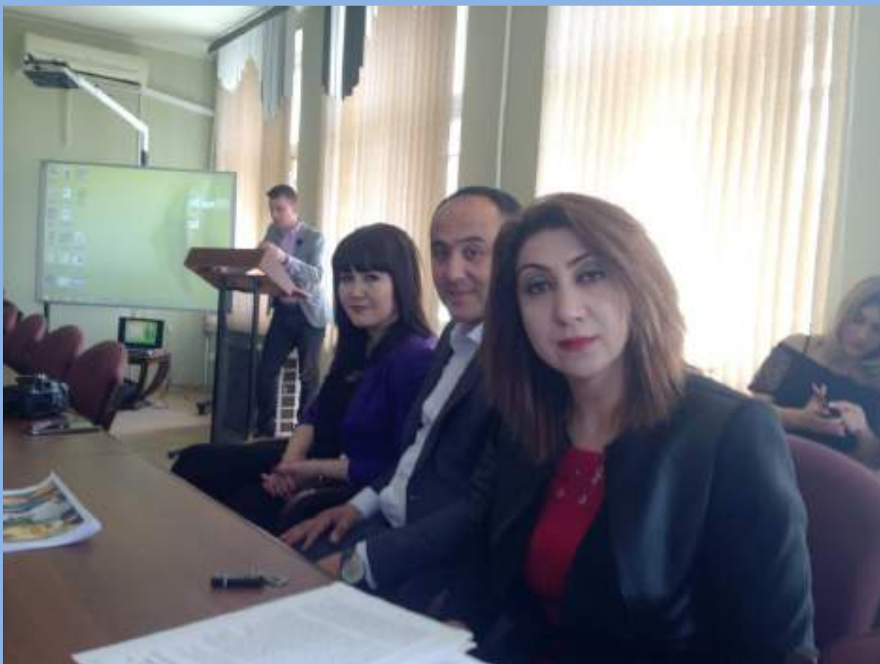
На семинаре «Фотография и память в диалоге культур»