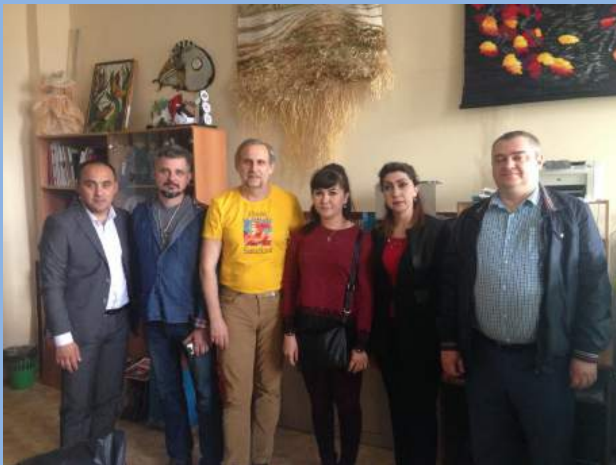
Посещение кафедры декоративно-прикладного творчества СГИК