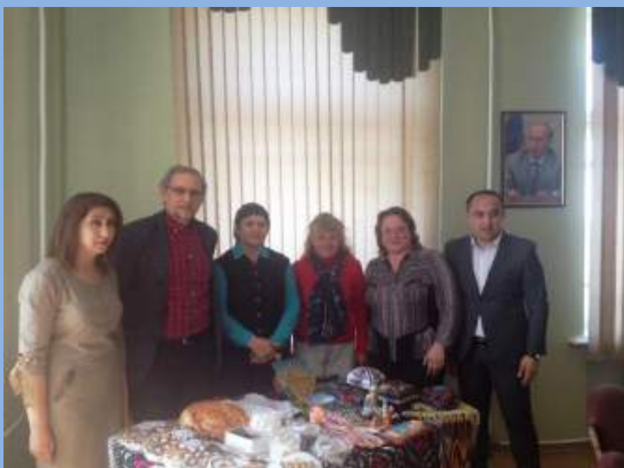
На презентации артефактов Самарканда