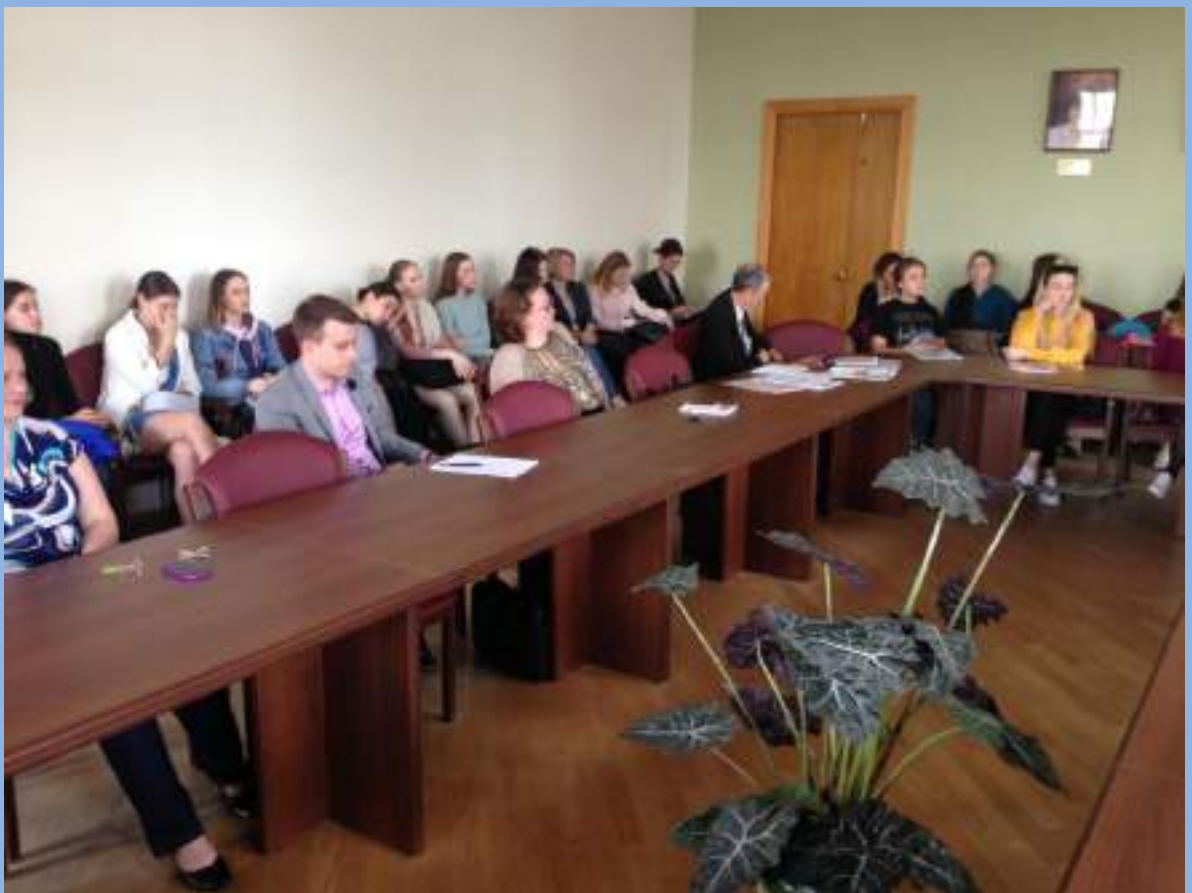
На семинаре «Философское наследие и современная наука в культурных практиках Самары и Самарканда»