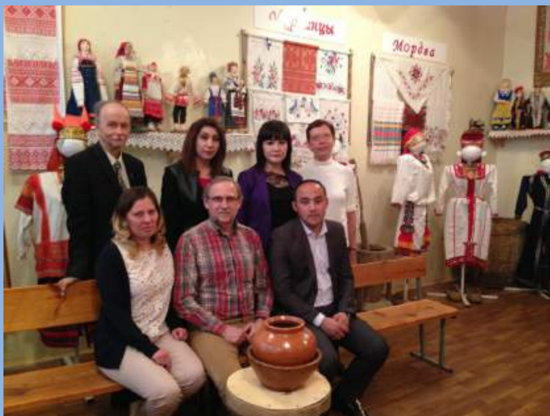
Посещение этнографического музея СГИК