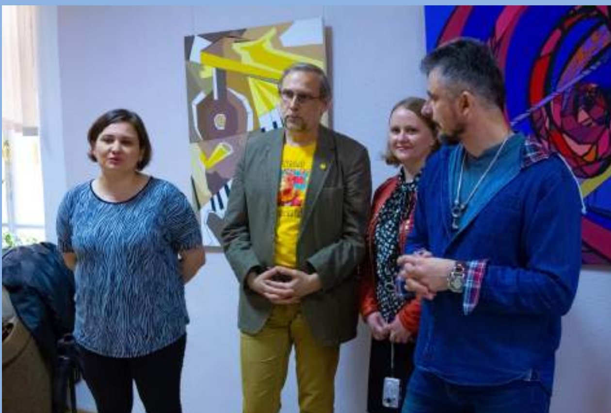
На открытии выставки «Живопись Джаза» в СГИК