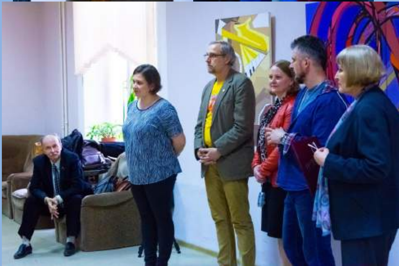
На открытии художественной выставки «Музыка Джаза»