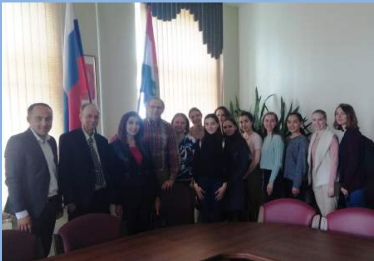
Участники семинара со студентами СГИК